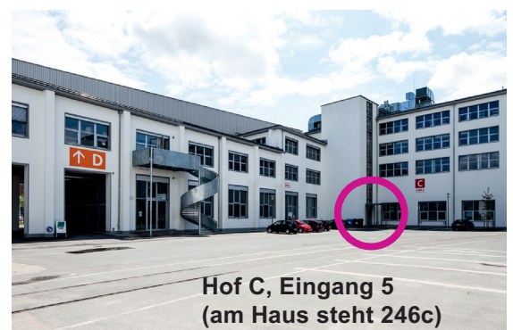
Hof C, Eingang 5 (am Haus steht 246c)